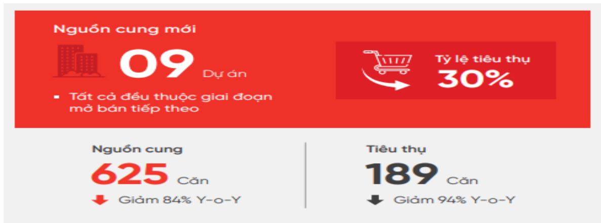
Nguồn cung và tiêu thụ mới theo tháng Đvt: Căn